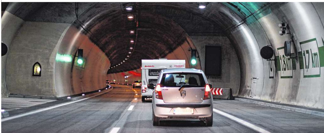
Das Bundesverwaltungsgericht beurteilt, ob der Lobautunnel umweltverträglich ist. Das Verkehrsministerium hatte ihn bereits bewilligt